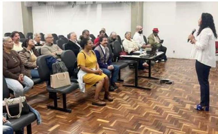
Legenda: Exemplo de Conselho em Funcionamento.

A região contou ainda com a articulação de outros conselhos e órgãos colegiados: Conselho Regional de Meio Ambiente, Desenvolvimento Sustentável e Cultura de Paz do Jabaquara - CADES-JA, Conselho Comunitário de Segurança - CONSEG-JA; Comissão de Mobilidade e Trânsito e Comissão Permanente de Ambulantes - CPA